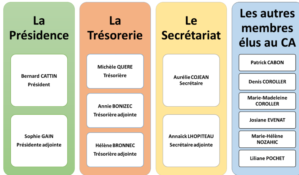
Figure 2: Composition du Conseil d'Administration 2019

Par ailleurs, des membres de l'association s'investissent à titre bénévole dans des événements sportifs cornouaillais (exemples : semi-marathon Locronan-Plogonnec-Quimper, le Kunt, la Kerné...) ce qui offre à SPT une meilleure visibilité locale.